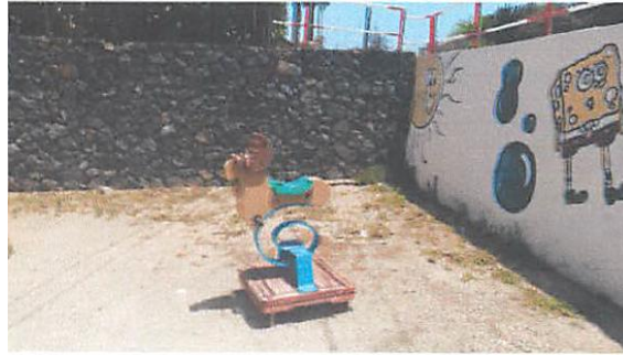
PARQUE INFANTIL CRUZ CARIDAD