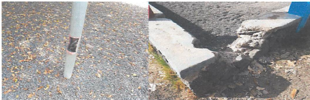
PARQUE INFANTIL LAS TOSCAS