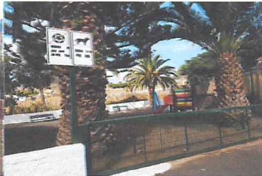
BARRANCO SAN JUAN